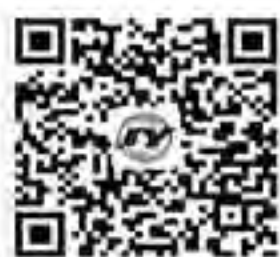
集团公司公众微信账号